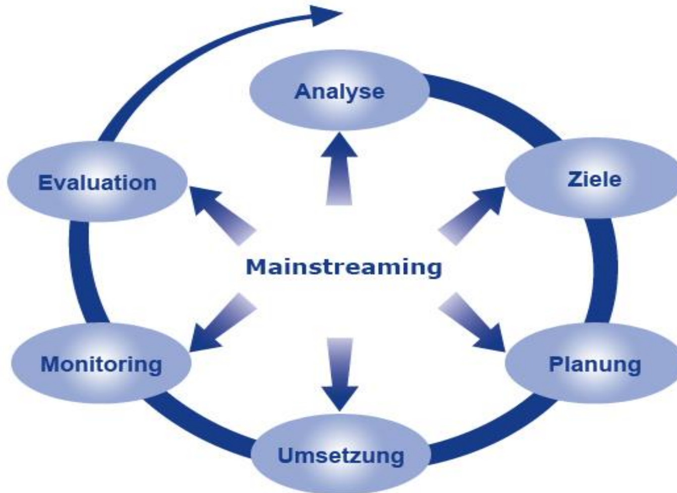
Abbildung 1: ESF-Zyklus